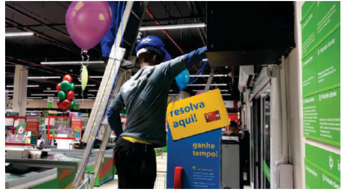
Migração de RACK TI Big Bompreço / Itaú