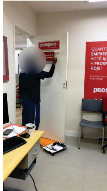
Reforma Geral Santander Prospera