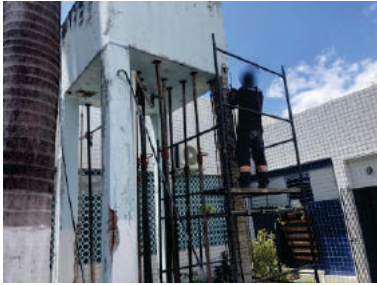
Recuperação Estrutural Dircon / Recife