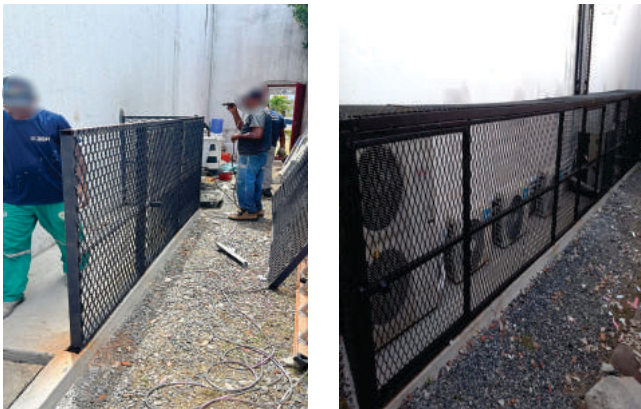
Gradil de proteção para condensadoras Drogasil