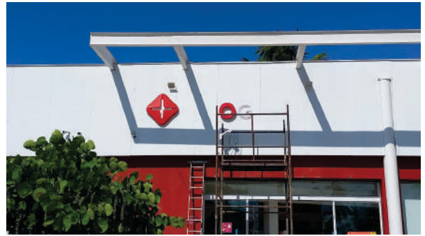
Instalação de letreiro Drogasil