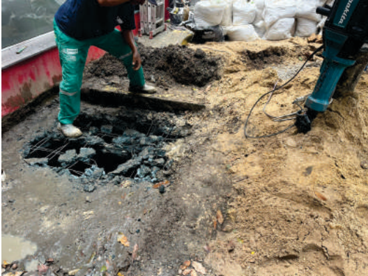
Expansão de fossa séptica Drogasil