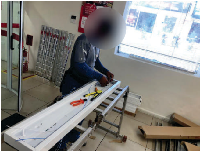
Retrofit Luminárias Santander