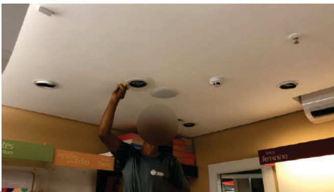
Retrofit Dicroicas Boticário