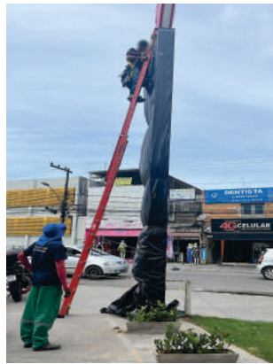
Instalação de totem Drogasil