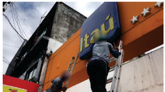
Substituição de logo Itaú