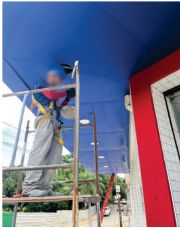
Retrofit de spots leds Pague Menos