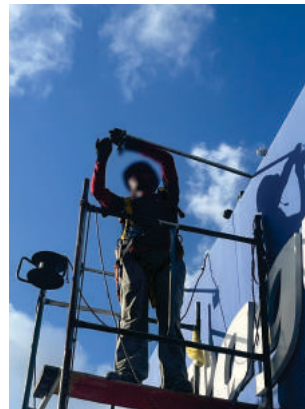
Retrofit de Iluminação Pague Menos