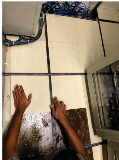
Aplicação de Paviflex Santander