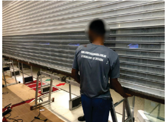
Reparo Porta esteira Centauro