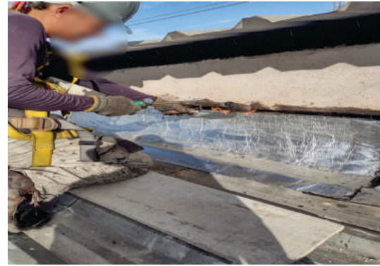
Aplicação de manta asfáltica Pague Menos