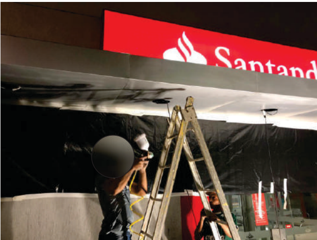
Pintura Geral Santander