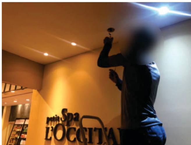
Retrofit led Loccitane