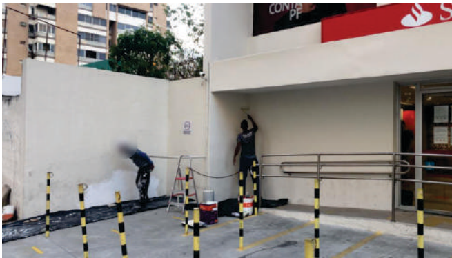
Pintura Geral Santander