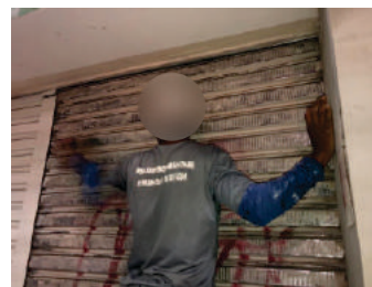
Revitalização de porta Boticário