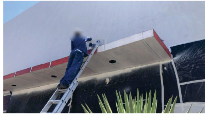
Revitalização de fachada Santander