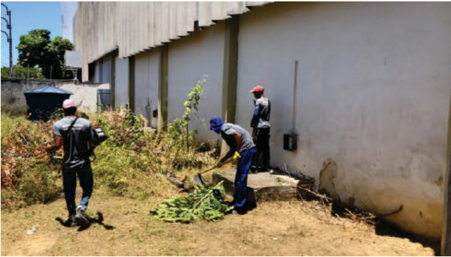
Capinação VD Boticário