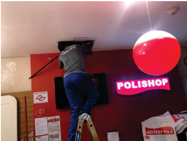
Passagem de rede/elétrica Polishop