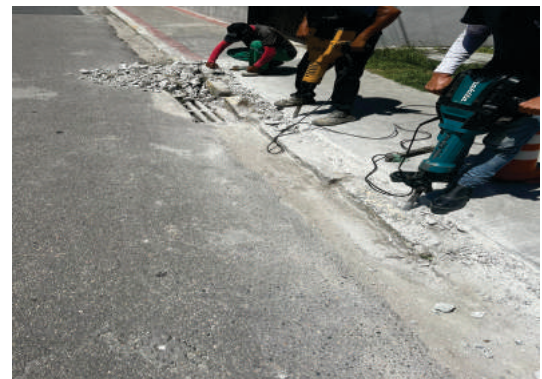
Regularização de calçada Drogasil